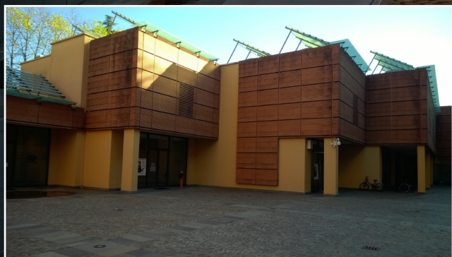
Edificio in cui sono collocate le aule del polo universitario.